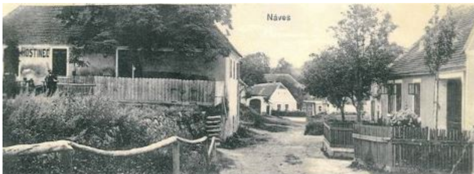
Mašovice na pohlednici z doby dětství Aloise Šoby

Po celá staletí se oba rody držely svých hospodářství, muži si brali za manželky vždy ženy z blízkého okolí.